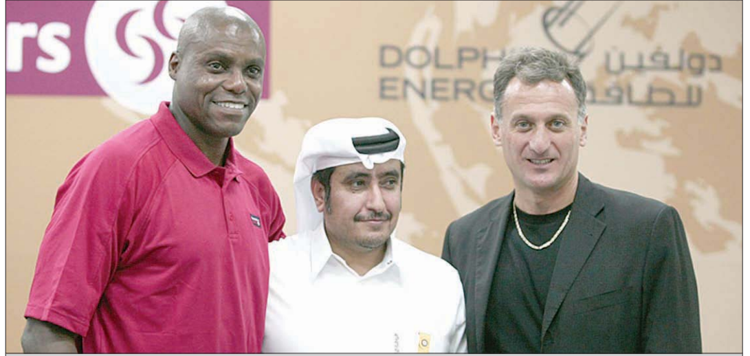
الكواري يتوسط كارل لويس وروبيرت إمامان

2016 والتقى بالمسؤولين الإعلاميين عن الملف الذين قدموا له معلومات وتفصيل عن ملف الترشيح. وعن معضلة المنشطات التي تهيئ أركان ألعاب القوى العالمية عموماً والأميركية على وجه الخصوص قال كارل لويس إن المنشطات مشكلة رياضية واجتماعية كبيرة تتداخل فيها العديد من العوامل التي تساهم في انتشار هذه الآفة، مؤكداً أن الحل يكمن في المدربين الذي يعملون على مد العائدتين واللاعبين بمواد محظورة وتشجيعهم على الغش والتدليس، وشدد لويس على أن الحل يكمن في جيل جديد من المدربين الأكفاء المجددين الذين لا يبحثون عن أسهل الطرق وأيسرها بلوغ المجد.